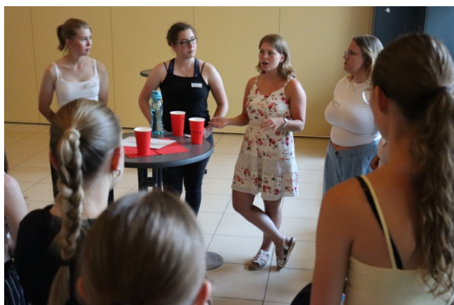
(Interessierte Oberstufenschülerinnen und -schüler im Gespräch mit Ehemaligen)

Die Veranstaltung erinnerte auch für die Ehemaligen ein wenig an ein Klassentreffen und fand großen Anklang bei den teilnehmenden Schülerinnen und Schülern der Oberstufe. Auch Lehrkräfte mischten sich unter die Besucher und trugen zur entspannten Atmosphäre bei.