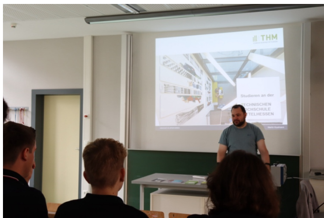
(Vortrag der THM)

und Provalids verschiedene Wege herkömmlicher und dualer Studiengänge erklären lassen.