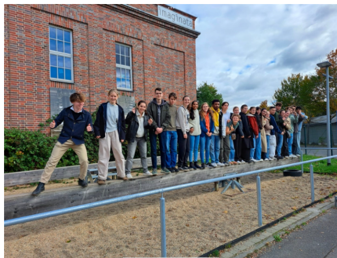
(Die Reisegruppe aus der 12. Klasse vor der „Imaginata“ in Jena)

Kurse bei ernsten und weniger ernsten Themen besser kennenlernen.