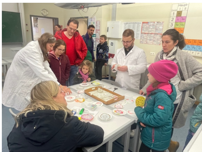
(Chemiker im Einsatz)

Ein weiteres Highlight war die Präsentation der Naturwissenschaften, die mit teils spektakulären Experimenten punkten konnten. Die Besucher in der Chemie konnten unter anderem der Herstellung von „Elefantenzahnpasta“ mit dem schnellen und beeindruckenden Ausbruch einer riesigen Schaumwolke beiwohnen, während in der Biologie beispielsweise Insekten mikroskopiert wurden.