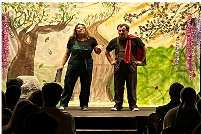
(Ausschnitt aus: „A Midsummer Night's Dream“)

Nach der ersten Thematik des ersten Stückes wurde es für die Oberstufe märchenhaft, magisch, mystisch - und vor allem urkomisch: In einer spritzigen Adaption von William Shakespeares Lustspiel „A Midsummer Night's Dream“ nahm das Phoenix Theatre die Schülerinnen und Schüler mit auf eine Reise durch das berühmte Werk des englischen Dramatikers. Dabei kombinierten die Schauspieler modernen Sprachgebrauch mit Shakespeare-Englisch und sorgten so für ein verständliches, aber authentisches Theatererlebnis.