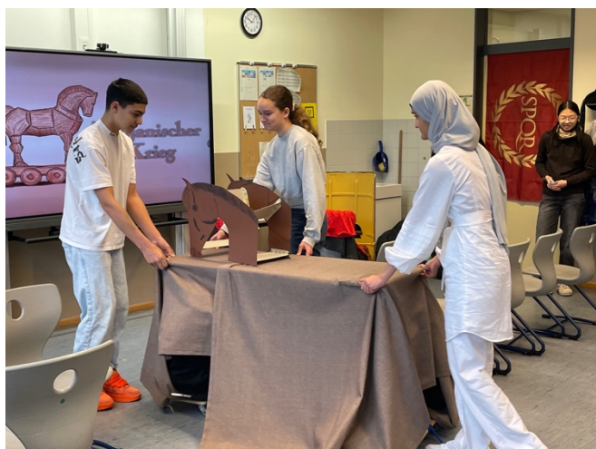
(Das Trojanische Pferd)

Die Fachbereiche der modernen Fremdsprachen sowie Latein hatten in einem Raum Ausstellungen zu den fünf angebotenen Sprachen vorbereitet, wo die Gäste Informationen über die Sprachenfolge erhielten. Theaterstücke in Französisch und Latein, darunter eines zu den Trojanischen Kriegen mit einer originellen Darstellung des Trojanischen Pferdes, gaben auch hier praktische Einblicke in das unterrichtliche Schaffen.