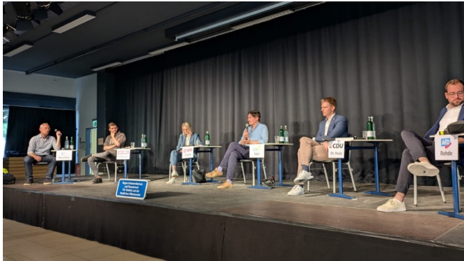
(Teilnehmerinnen und Teilnehmer der Podiumsdiskussion inklusive Moderator)

demokratischen Meinungsspektrum zu wahren. Eine solche Entscheidung wurde auch an anderen Schulen im Schulamtsbezirk, wie der Singbergsschule in Wölfersheim und am Gymnasium Oberursel, getroffen.